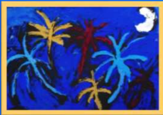
Noa Breznik, 6.b