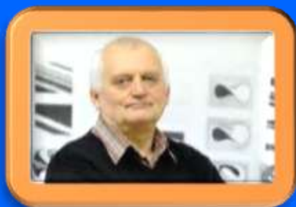
akademik Vladimir Paar