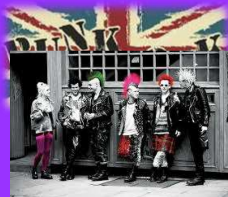
drugoj Britaniji i

Tijekom pisanja ovog članka slušala sam The Ramones, band od kojeg je sve to počelo. Nadam se da će ovaj članak nekog potaknuti na slušanje punka.