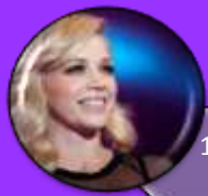
1. Jelena Rozga